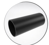
Труба ПНД 50 мм.