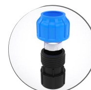
Муфта компрессионная 50x1 1/4 с внутренней резьбой