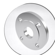
Фланец стальной DN50