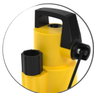
Насос KSB Ama-Drainer