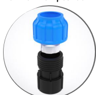
Муфта компрессионная 32x1 1/4 с внутренней резьбой