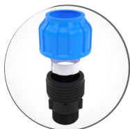
Муфта компрессионная 32x1 1/4 с внешней резьбой