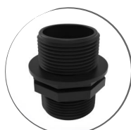
Ниппель симметричный с резьбой 1 1/4