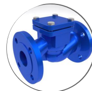
Обратный клапан DN50