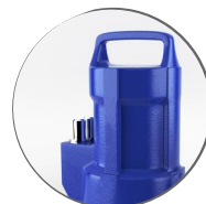
Насос KSB Ama-Porter