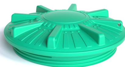
Винтовая крышка RODLEX-UN800