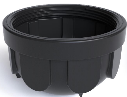
Лотковая часть RODLEX-R1

Диаметр КНС насосной станции РОДЛЕКС™ составляет 800 мм, высота корпуса КНС может составлять до 3500 мм и более, стандартный корпус бытовой насосной станции составляет 1500 мм и может быть удлинен до необходимой высоты стандартными универсальными горловинами РОДЛЕКС™ с шагом 500мм.