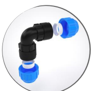
Угольник компрессионный 90°